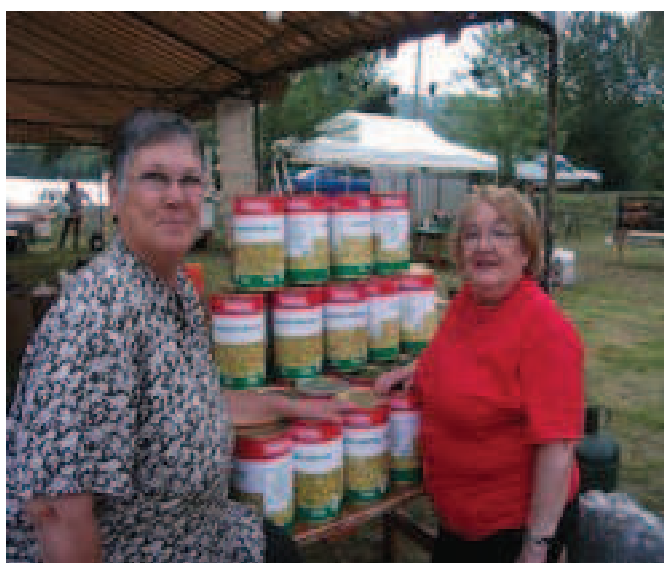
LE FAMEUX GROUPE « LES FLAGEOLLETES »