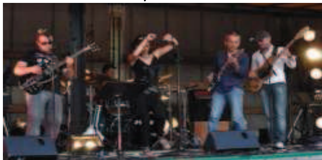
LES GROUPES « SOWATT » ET « TRIO BAZARD »