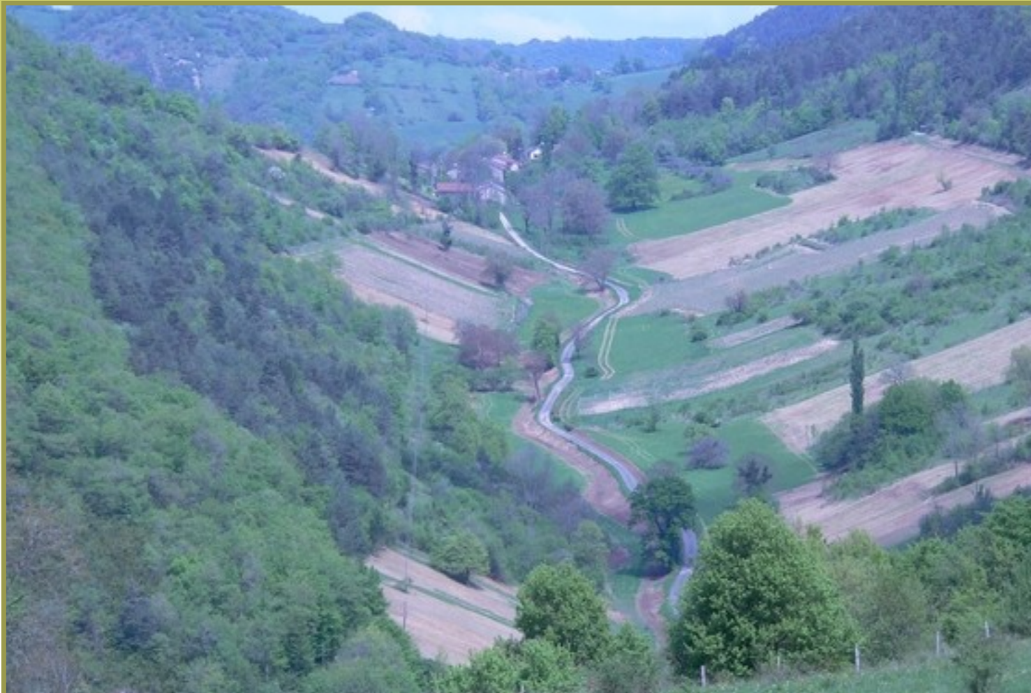
SONTHONNAX LE VIGNOBLE VU DE MALAVAL EN ÉTÉ