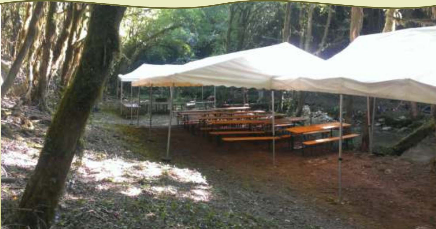
AU CŒUR DE L'ÉTÉ 2015, L'ENCHANTEUR MERLIN ATTEND LES PÊCHEURS AU BIEF DE NOIREFONTAINE