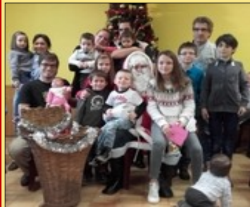
LA JEUNESSE (à gauche)