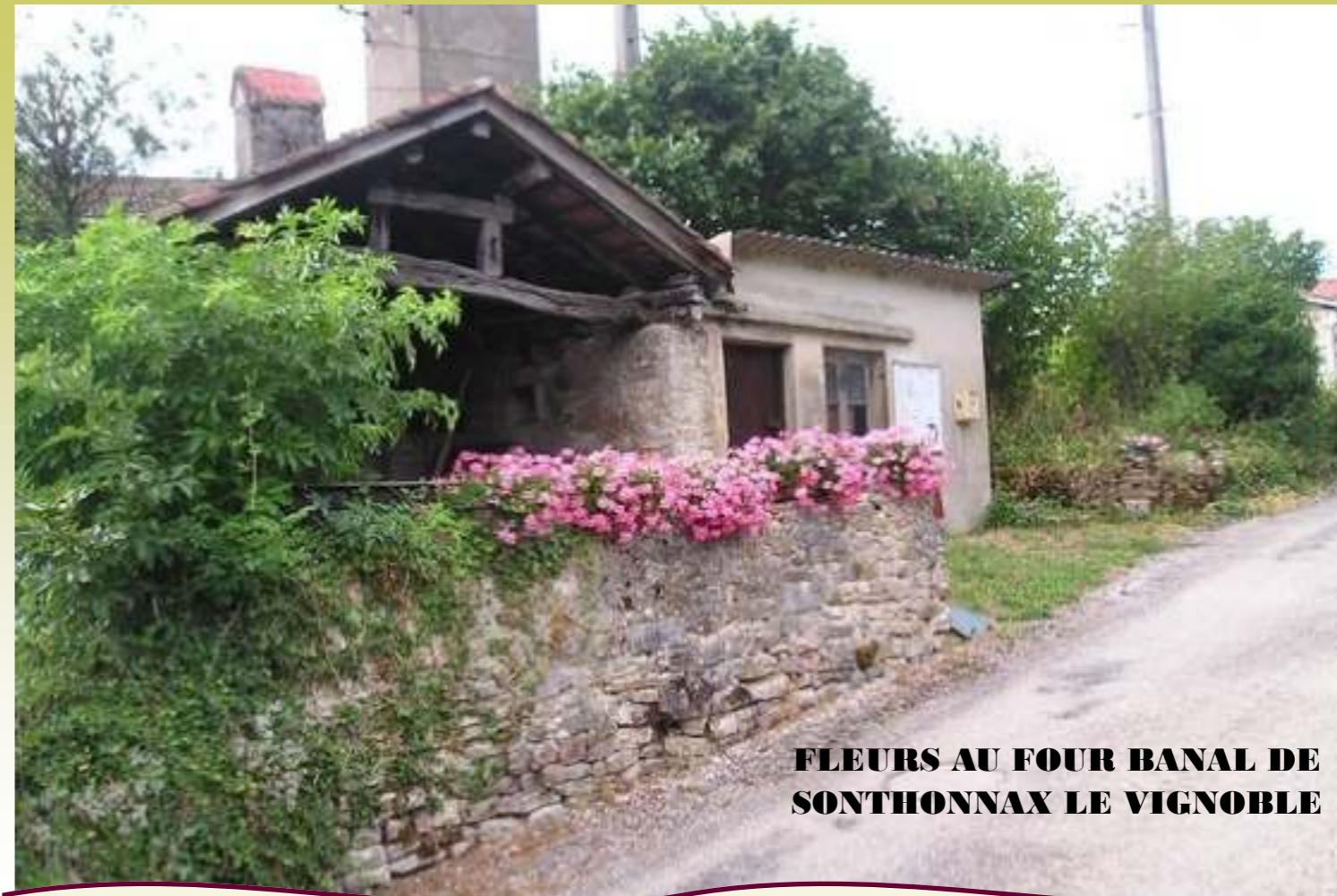
FLEURS AU FOUR BANAL DE SONTHONNAX LE VIGNOBLE