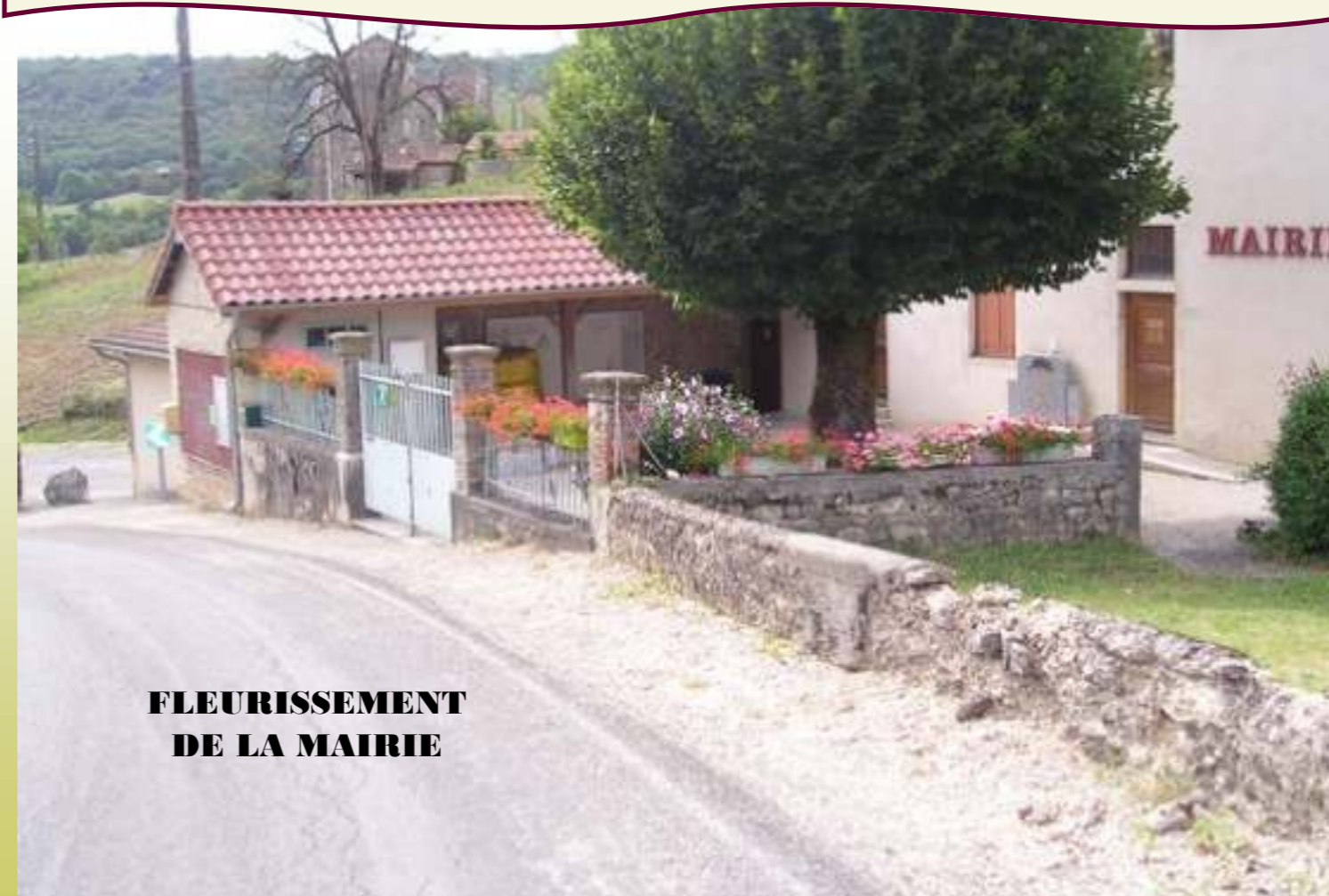
FLEURISSEMENT DE LA MAIRIE