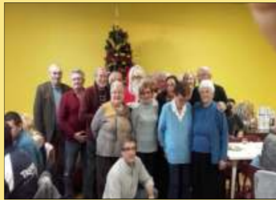
NOS AINÉS (à droite)