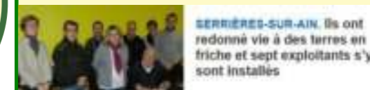
SERRIÈRES-SUR-AIN. Ils ont redonné vie à des terres en friche et sept exploitants s'y sont installés

article de presse paru dans « Le Progrès » du 15 janvier 2015