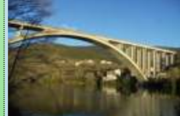
Notre pont : retour au 30 septembre ?