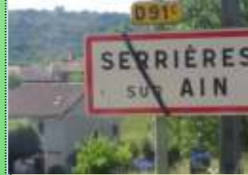
Loi «NOTRe» & crêpe noir sur Serrières-sur-Ain : DEUIL DÉFINITIF ?