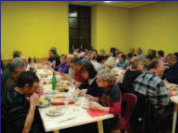
C'ÉTAIT LE 20 FÉVRIER EN SALLE POLYVALENTE