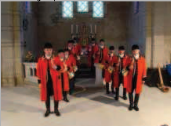
C'ÉTAIT LE 29 MAI EN L'ÉGLISE DE SERRIÈRES